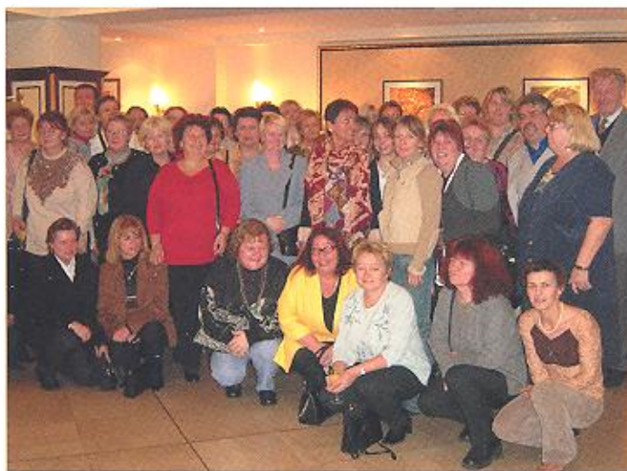
November 2003 Die Volkshilfe Wien ehrt langjährige MitarbeiterInnen.