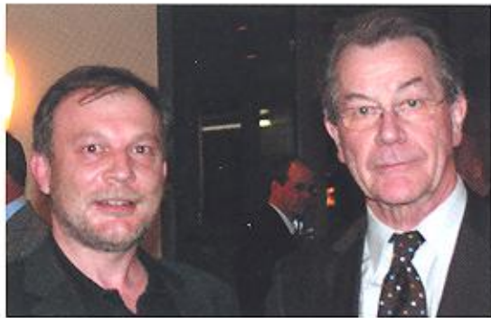
April 2006 Zu Besuch bei Deutschlands SPD- Minister Franz Müntefering.