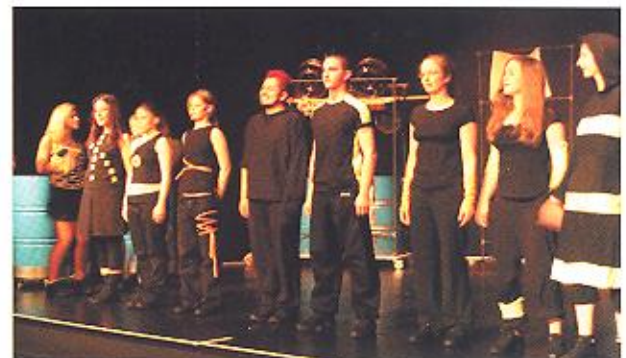
Juni 2006 hipopera feiert seine erste Premiere.