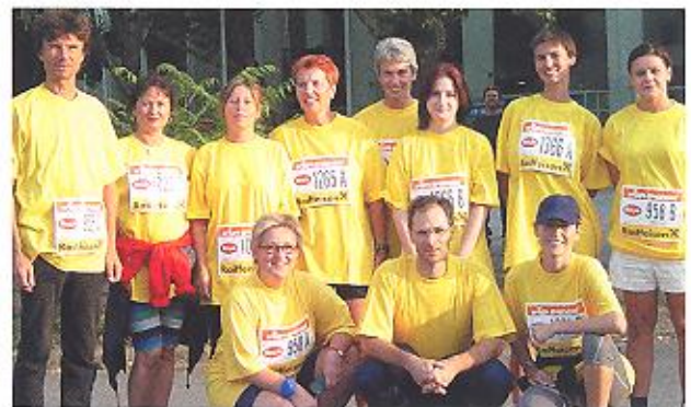
September 2003 Die Volkshilfe Wien beim Business-Run.