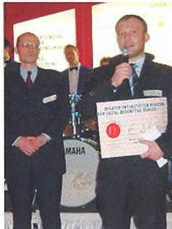
März 2003 Spende vom Verband der Versicherungsmakler.