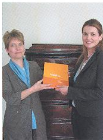
April 2006 Hollywoodstar Julia Ormond besucht SOPHIE.